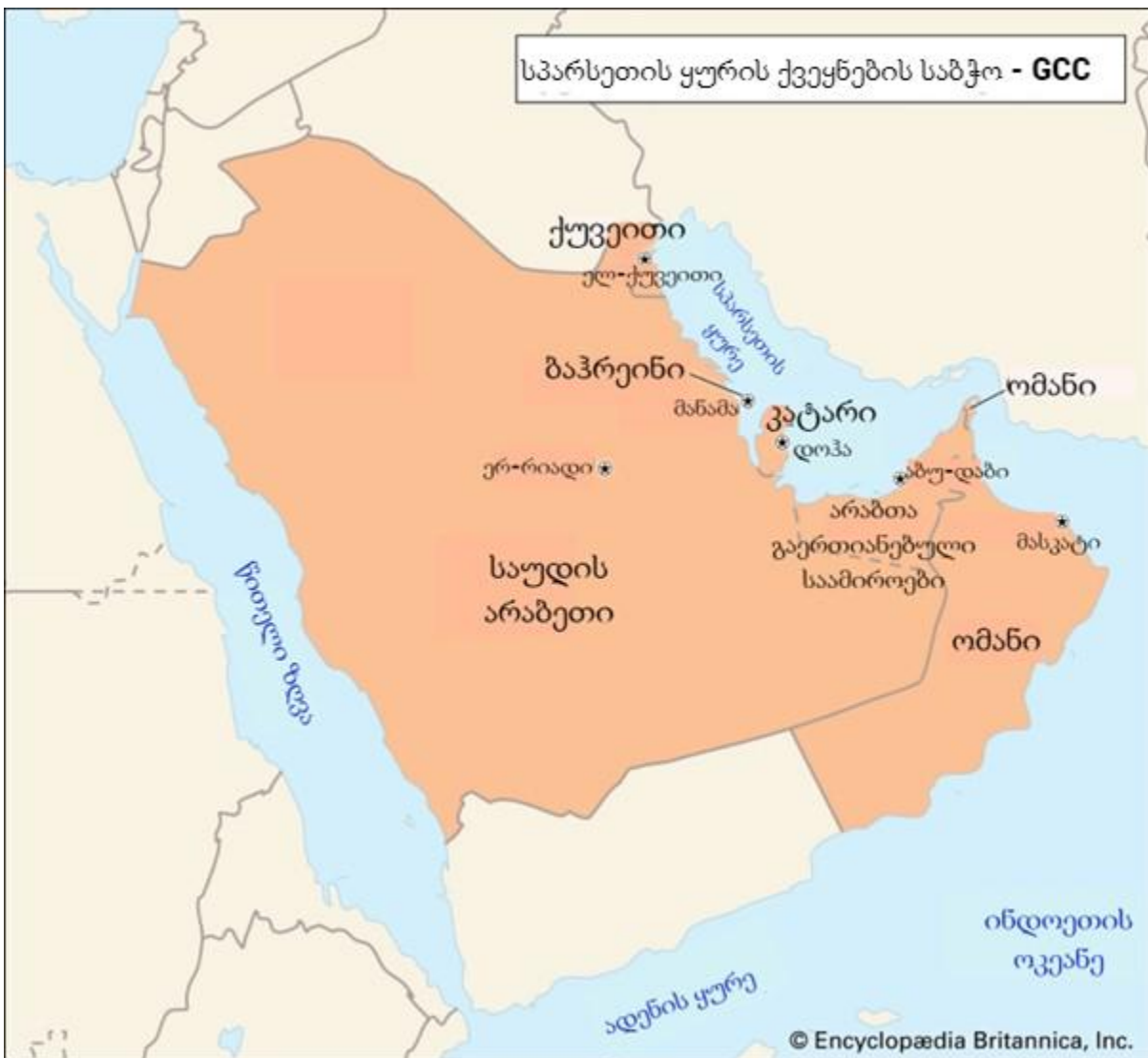
Britannica, T. Editors of Encyclopaedia (2021). Gulf Cooperation Council. Encyclopedia Britannica. https://www.britannica.com/topic/Gulf-Cooperation-Council

ჩამოყალიბებული ჰქონდათ საერთო იდენტობა, რომელსაც „ხალიჯის“ უწოდებენ და რომელიც განასხვავებს მათ სხვა არაბული ხალხებისაგან (Karolak.M, 2019). თუმცა, უნდა აღინიშნოს, რომ საუდის არაბეთი ყოველთვის განიხილებოდა როგორც ამ საბჭოს ლიდერი ქვეყანა. საუდის არაბეთს გააჩნია ყველაზე მძლავრი ეკონომიკა, რადგანაც იგი რეგიონის ნავთობით ყველაზე მდიდარი ქვეყანაა- მთლიანი შიდა პროდუქტისა და მთლიანი შიდა პროდუქტის ერთ სულზე გაანგარიშებით იგი პირველ ადგილს იკავებს ყურის რეგიონში. უდიდესია ფართობითაც და მოსახლეობის რაოდენობითაც, ამავდროულად ეს უკანასკნელი საკუთარ თავს ისლამური სამყაროს ლიდერ ქვეყნადაც მიიჩნევს, რასაც ისლამური სამყაროს ორი წმინდა ქალაქის- მექისა და მედინის მის ტერიტორიაზე მდებარეობა განაპირობებს (Al Jazeera English, 2019).